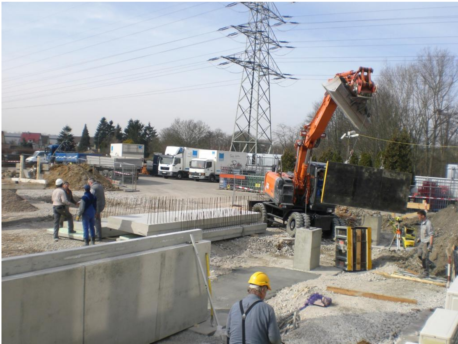
Der Bereich von Tor 1 entsteht.