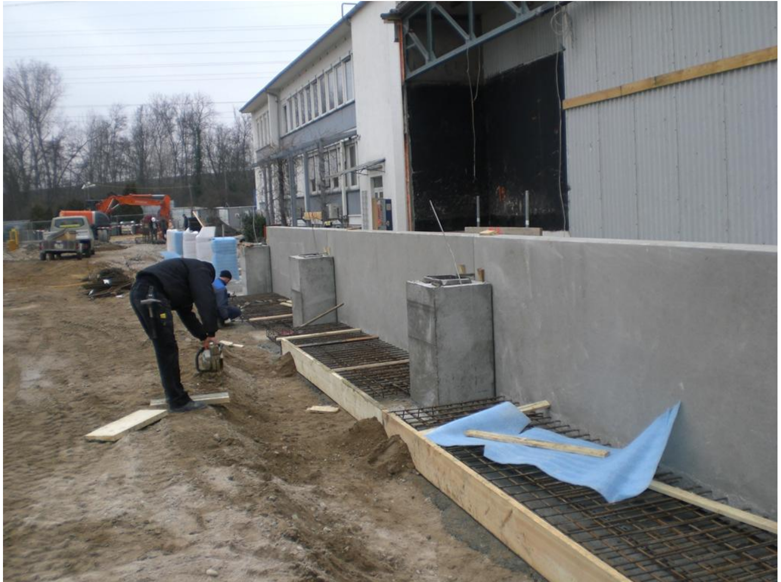
Die Fundamente an der Hofseite werden gegossen.