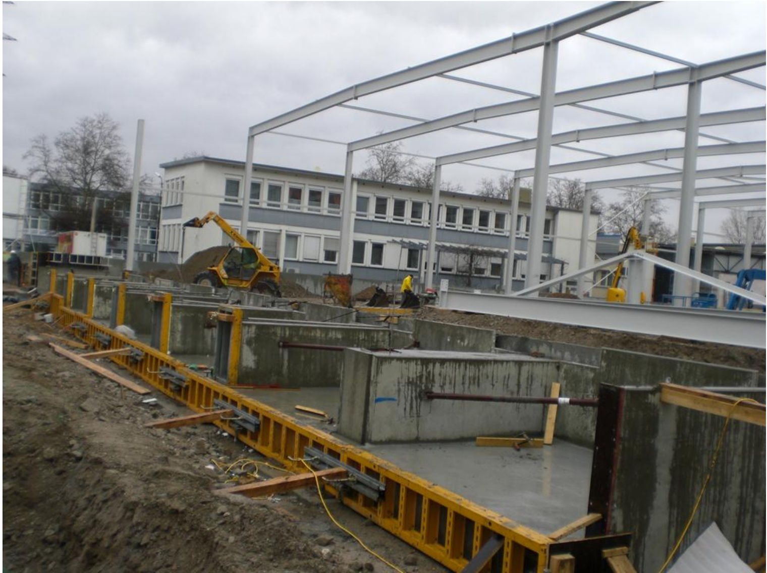
Die Überladerampen werden vorbereitet.