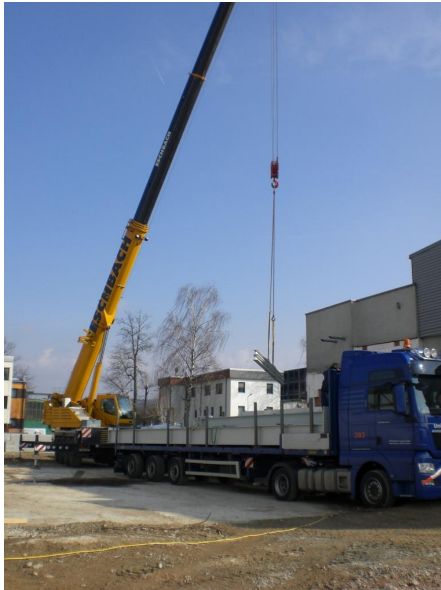
Der erste Stahl für die Halle.