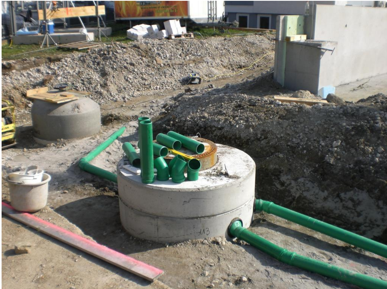
Wichtig: Ö- und Benzinabscheider