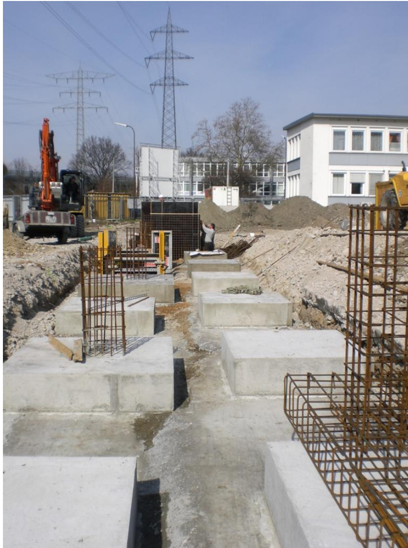
Der Fotograf steht an Tor 9.